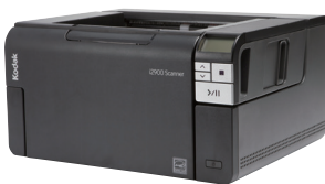
Kodak i2900 scanner (対象書類が A4 まで)