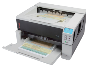
Kodak i3400 scanner (対象書類が A3 まで)